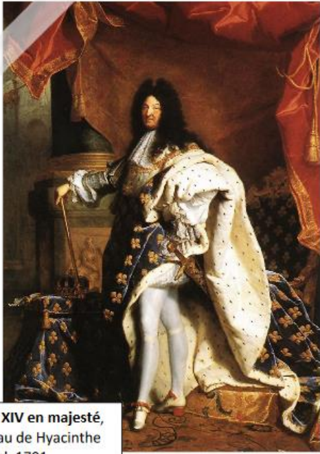
Louis XIV en majesté, tableau de Hyacinthe Rigaud, 1701